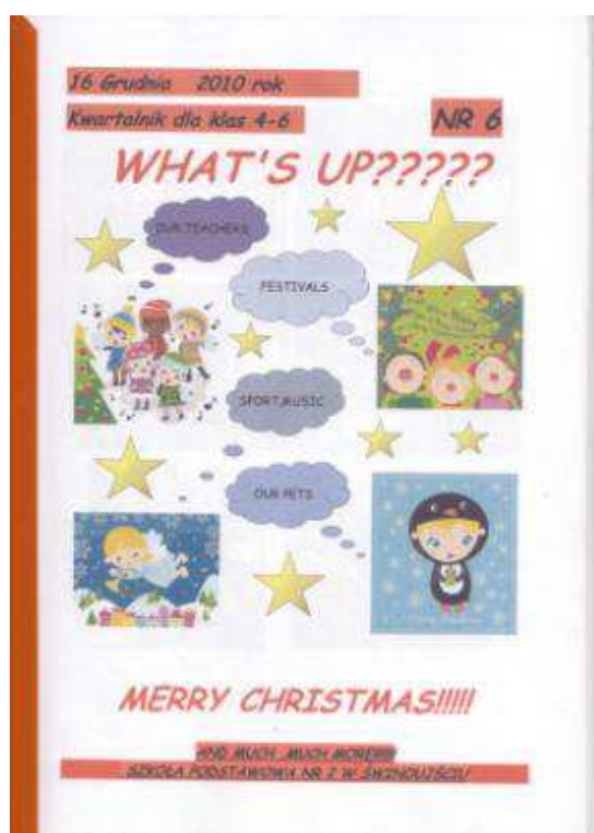
Fot. 5. „What’s Up????”, Szkoła Podstawowa nr 2 im. Majora Henryka Sucharskiego w Świnoujściu

„What’s Up????” jest dwujęzycznym kwartalnikiem uczniów klas IV–VI, wydawanym przez Szkołę Podstawową nr 2 im. Majora Henryka Sucharskiego w Świnoujściu. Drukowany w formacie A4, na zwyczajnym papierze, bindowany, ma kolorową okładkę i objętość około 32 stron. Ukazuje się na terenie szkoły w nakładzie do 50 egz. i kosztuje od 2 do 3 zł. Pismo ukazuje się od kilku lat (redakcja nie podała daty ukazania się pierwszego numeru). Adresatami periodyku są uczniowie i nauczyciele.