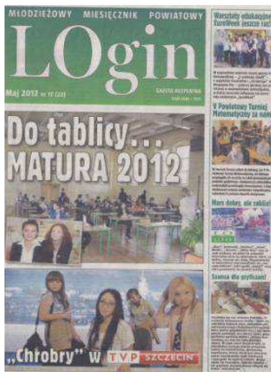
Fot. 1. „LOgin. Młodzieżowy Miesięcznik Powiatowy”, Liceum Ogólnokształcące im. Bolesława Chrobrego w Gryficach

Pismo ma przejrzystą szatę graficzną. Na każdej „jedyńce” pisma zamieszczane są zdjęcia oraz krótkie zapowiedzi głównych tematów numeru. Struktura i forma miesięcznika świadczą o sprawnie funkcjonującym zespole redakcyjnym, na łamach pisma znajdują się ciekawe infografie lub różnego rodzaju infografiki 9 .