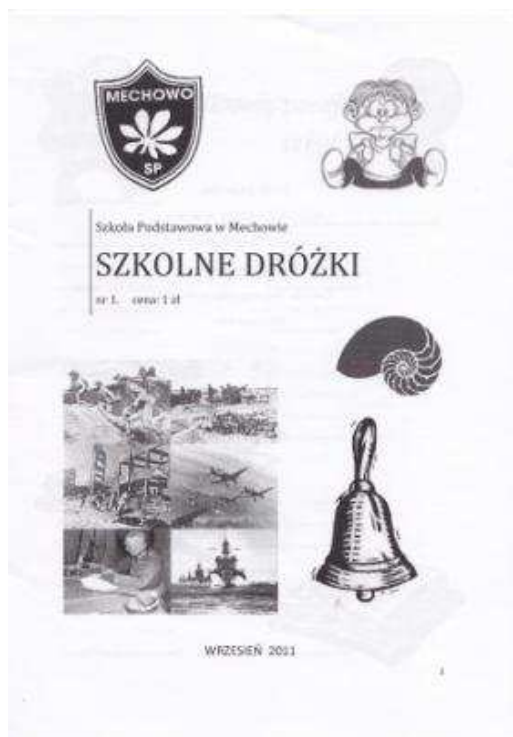
Fot. 4. „Szkolne Dróżki”, Szkoła Podstawowa w Mechowie