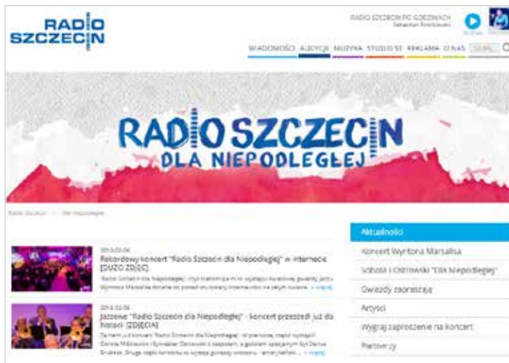
Logo koncertów jubileuszowych PR Szczecin

rykański wirtuoz trąbki Wynton Marsalis, któremu towarzyszyła orkiestra Jazz at Lincoln Center 71 .