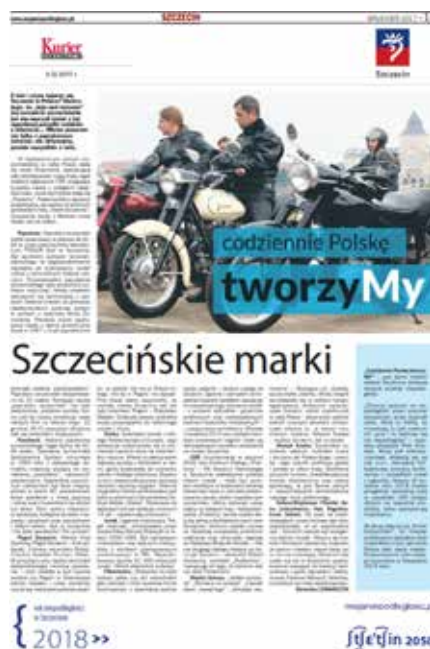
Jubileuszowy dodatek Urzędu Miasta Szczecin do „Kuriera Szczecińskiego” z 14 grudnia 2017, s. 11

We współpracy Urzędu Miasta Szczecin z regionalnym dziennikiem „Kurierem Szczecińskim” przygotowano cykl dwunastu suplementów (od listopada 2017 do listopada 2018 r.), ukazujących zmieniający się Szczecin na przestrzeni lat. Celem publikacji było pokazanie różnorodnej i bogatej historii miasta. Prezentowano mieszkańców miasta, którzy mieli znaczący wpływ na kształtowanie jego tożsamości.