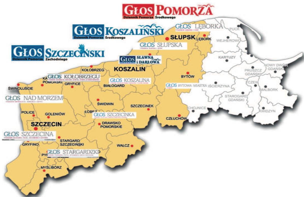
Rysunek 2. Tygodniki trzech mutacji „Głosu – Dziennika Pomorza”

dzaju inicjatywach, podejmowanych przez wszystkie trzy redakcje, biorą udział tysiące mieszkańców regionu. Na przykład w akcji „Biegaj z nami” uczestniczyło 5 tys. mieszkańców Pomorza Zachodniego, a w „Wyścigu rowerowym Głosu” ponad tysiąc najmłodszych mieszkańców obszaru.